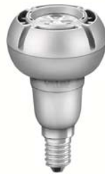
Reflektor mit E14-Sockel