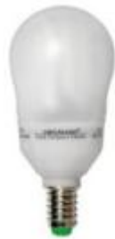
Energiesparlampe in Glühlampenform