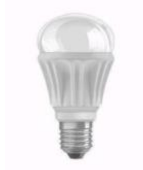
Glühlampenform mit E27