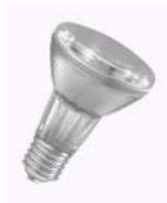
Metall dampflampe mit Reflektor