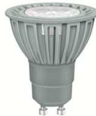
LED PAR GU 10 Sockel