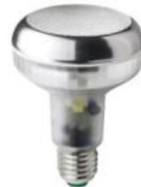
Energiesparlampe in Reflektorform R80