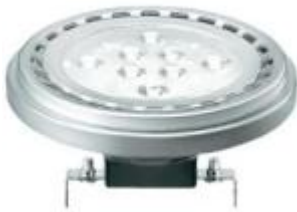
Reflektorlampe für AR111-Ersatz

Weitere Produktbeispiele, die zu dieser Kategorie gehören: